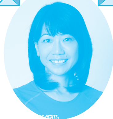
シドニー五輪女子マラソン 金メダリスト 高橋 尚子さん